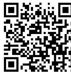
QR Code ADVANCE

Telefone: +55-11-3044-0867 Email: advance@advanceconsulting.com.br Web-site: www.advanceconsulting.com.br